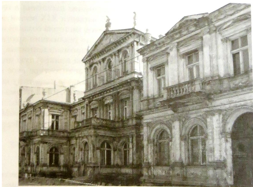
Илл. 3. Здание Городского кредитного общества, ул. Поморска, 21. 2011

можно назвать эклектичным, напоминающим архитектуру Ренессанса и дворцы в стиле барокко. Манера отделки фасадов и необычайно насыщенное внутреннее убранство свидетельствуют о высоком мастерстве и прекрасном представлении архитектора об исторических стилях, которые вдохновляли его на создание пышных, но в тоже время гармоничных образов 15 .