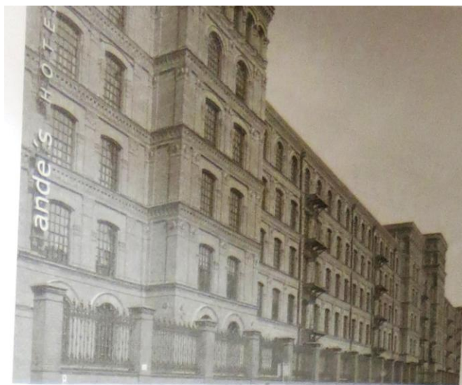
Илл. 2. Прядильная фабрика Познаньского, ул. Огородова, 17. 2011

зан и украшен полукруглым узорчатым ризалитом, его верхнюю оконечность венчает внушительных размеров купол. Ближе к углу расположены двухосные ризалиты, украшенные балконами и окантованные рустом. Первый этаж здания по высоте превосходит остальные, здесь предполагалось разместить магазины. Высокие арочные витрины, отделенные друг от друга пилястрами, придают ему ритмичность, поверхность стен декорирована рустом в стиле итальянских дворцов Ренессанса. Отделка второго этажа отличается особым великолепием убранства - обрамлением окон по типу эдикул, увенчанных полукруглыми фронтонами. Третий и четвертый этажи здания декорированы скромнее, но также с элементами архитектуры Ренессанса. Фасад увенчан высоким пышным карнизом, над которым возвышается упомянутый купол. Благодаря тщательно проработанным формам и удачному расположению здание является уникальным примером архитектуры неоренессанса на фоне других памятников Лодзи 13 .